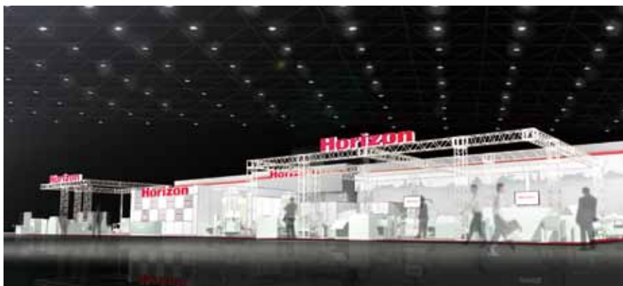
El stand Horizon de 900 metros cuadrados, será el cuarto más grande de la feria.