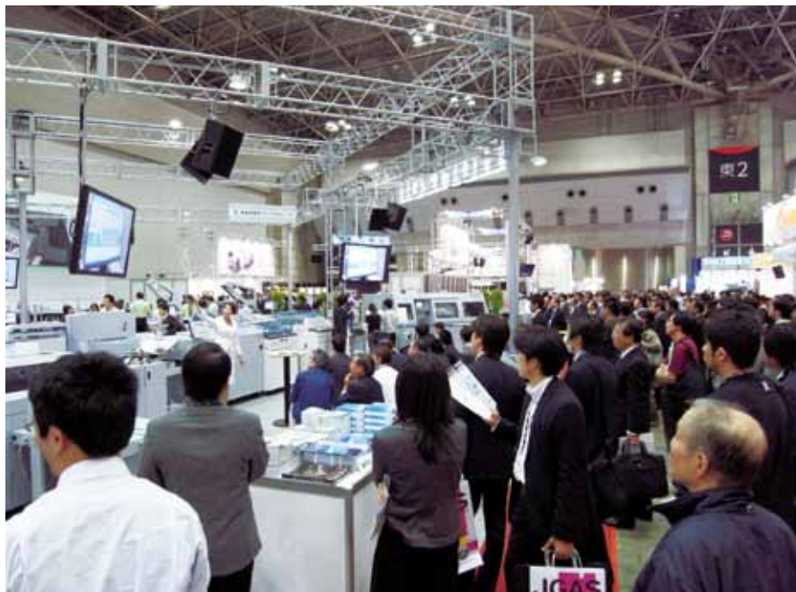
Se espera que la IGAS atraiga a unos 100.000 visitantes. La foto muestra el stand de Horizon en IGAS de 2009 en Tokio, que se celebró en el mismo lugar.