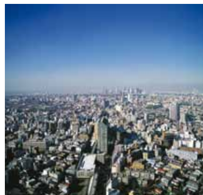
La casi interminable ciudad de Tokio será la sede de la IGAS 2011.

Horizon coopera con los principales fabricantes de la industria de la impresión digital y offset, incluyendo Komori, HP, Screen, Fujifilm y Canon. Muchos de los trabajos impresos en estos equipos se encuadernarán con los equipos Horizon.