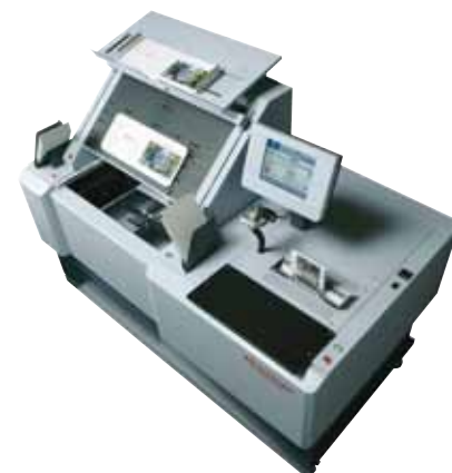
La solución para la encuadernación semi-automática de libros de tapa dura Horizon HCB-2

El dinámico y creciente mercado de libros de fotos ofrece grandes oportunidades de negocio. Horizon proporciona el equipo necesario y el know-how para la producción de libros de alta calidad. Los libros de tapa blanda se encuadernan en la Horizon BQ-160PUR. La cubierta está perfectamente hendida con la hendidora de impacto Horizon CRB-160. La extraordinaria calidad y sólida encuadernación con cola PUR hacen que sean únicos en su clase. La encuadernación en tapa dura se realiza con la encuadernadora de tapa dura HCB-2.