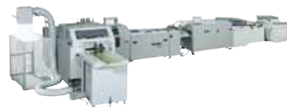
Horizon bobina a catálogo, es la solución para la confección de revistas a partir de bobina. Puede encuadernar hasta 6.000 revistas con una velocidad de hasta 180m/min.

El segundo sistema alimentado desde bobina web será la confeccionadora de revistas con grapado a caballete StitchLiner6000 Digital. Este equipo está conectado directamente al desbobinador y al módulo de corte. Por ejemplo, el sistema puede producir catálogos de 24 páginas en formato A4 acabado, con una velocidad de hasta 6.000 catálogos por hora.