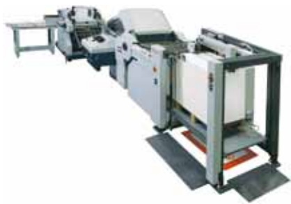
La plegadora totalmente automática B1 con cuchillas AFC-746F y el stacker de alta producción Horizon PSX-56.